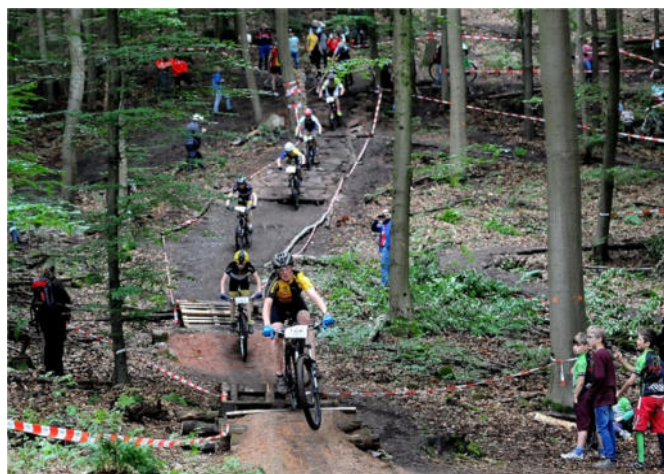
Rockgarden im Rennen der U15männl., Romb-Trails-Race 2016

Für das XCO-Rennen wurde vom RSC St. Ingbert extra eine neue Strecke angelegt, die dank entsprechendem Gestattungsvertrag mit dem Forst, als dauerhafte Trainingsstrecke zur Verfügung steht. Um alle Trainingsaspekte im modernen MTB-Sport abdecken zu können, wurden kontinuierlich weitere Streckenabschnitte ergänzt. Es zeigte sich, dass wir mit unserer Strecke und der Veranstaltung den Nerv der Zeit getroffen haben. Uns ist es gelungen, auf Anhieb die Bedürfnisse der nationalen Elite, samt Trainerstab und Funktionäre zu erfüllen. Im Bereich der Nachwuchsbundesliga wurde unserer Strecke attestiert, neue Maßstäbe