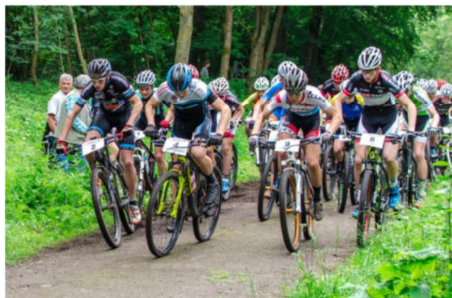
Start U17männlich, Bomb-Trails-Race

Die überaus positive Resonanz quer durch die Republik zu unserer MTB-Veranstaltung in 2016 auf allen Ebenen der MTB-Szene hat dazu geführt, dass wir dann auch direkt den Zuschlag für die Deutschen Meisterschaften in der olympischen Mountainbike-Disziplin CrossCountry für 2018 erhalten haben.